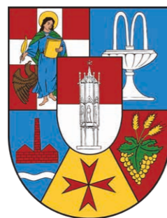
Wien, Favoriten, 15. August 2024